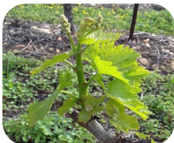
5/6 feuilles étalées (Stade F)