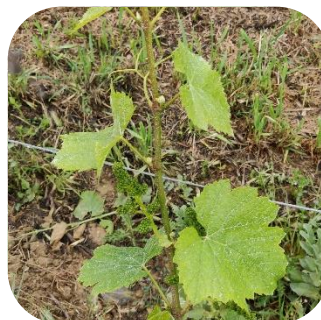
Boutons floraux séparés (Stade H)

Une belle avance est observée par rapport à la semaine dernière. Les parcelles observées les plus tardives sont à 5/6 feuilles étalées (stade F). Le stade moyen est boutons floraux agglomérés (stade G). Certains Chardonnays sont à boutons floraux séparés. Les parcelles en secteur tardif, taillées tardivement ou gelées rattrapent leur retard.