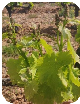
Boutons floraux agglomérés (Stade G)